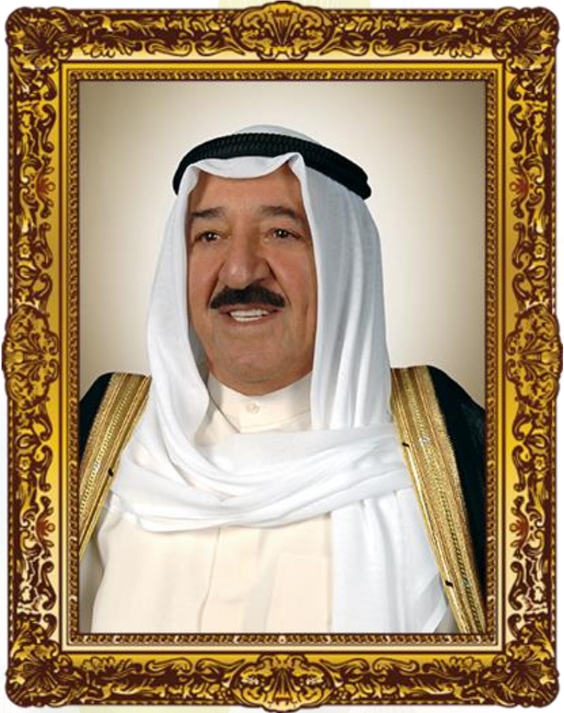
حضرة صاحب السمو أمير البلاد الشيخ صباح الأحمد الجابر الصباح حفظه الله ورعاه